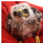
100 euros Soins et nourrissage d'un rapace