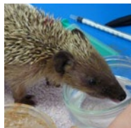
50 euros Soins et nourrissage d'un hérisson