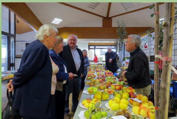
13èmes rencontres « Vergers » à Chênex, le 29 octobre 2017.

Enfin, ayant connu un grand succès, la troisième édition du « Vuache Clean Up » sera éditée le 18 Septembre, et l'organisation des 16èmes rencontres autour des vergers traditionnels du Salève au Vuache se tiendra fin octobre.